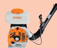
atomizzatore a spalla STIHL SR 450